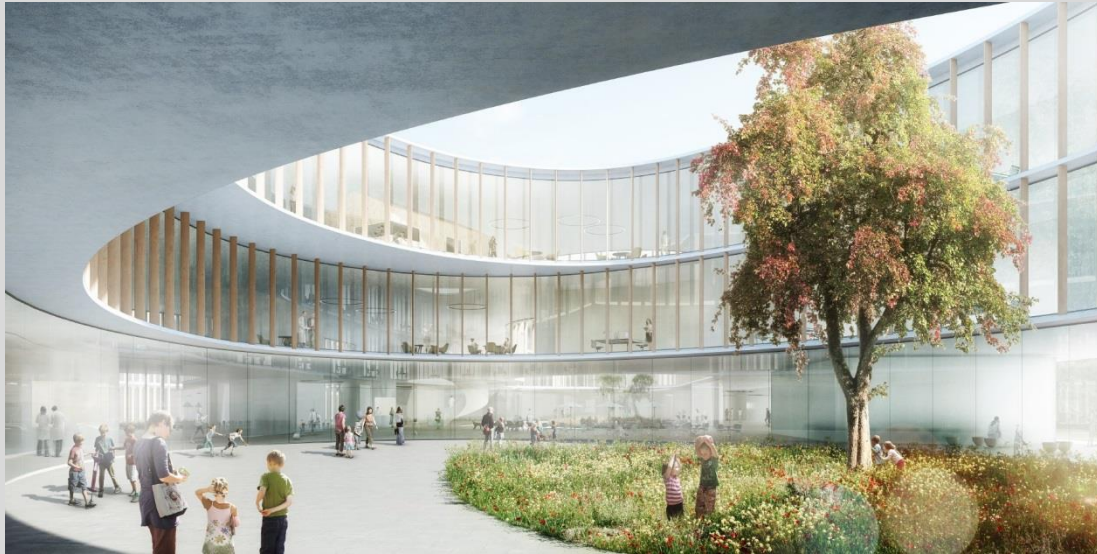
Entwurf des Gewinners - Nickl & Partner Architekten, München